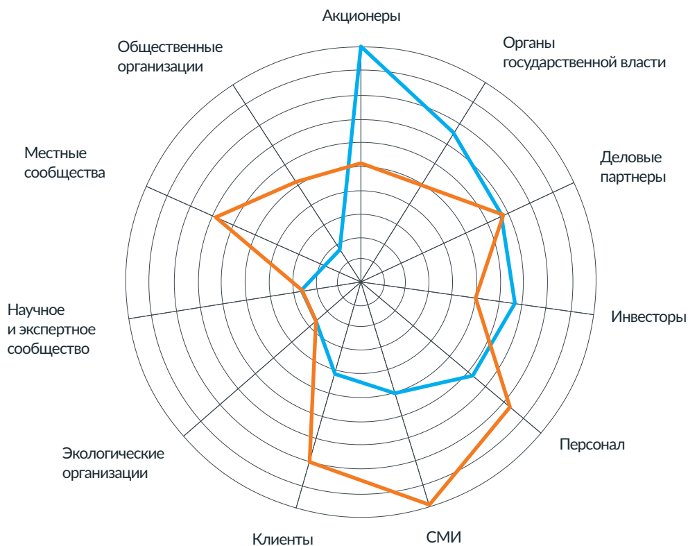
Ранговая карта заинтересованных сторон ПАО «Ростелеком»

В 2017 году по результатам анкетирования 50 респондентов из 11 категорий стейкхолдеров (заинтересованных сторон) с широкой географией, а также сравнительного анализа международных, отечественных и отраслевых практик была впервые сформирована ранговая карта заинтересованных сторон, отражающая взаимозависимость между ними и компанией.